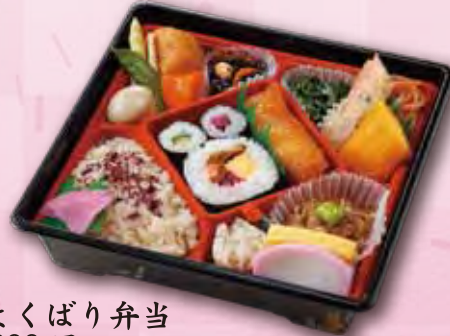
10 よくばり弁当 800 円 (21.0×21.0cm)