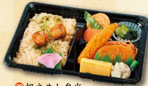
28 帆立めし弁当 600 円 (15.5×21.5cm)