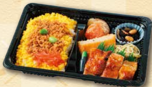
30 鶏そぼろ弁当 500 円 (15.5×21.5cm)