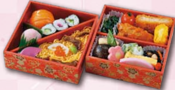
4 二段弁当〈おすし〉 1,200 円 (12.5×12.5cm)