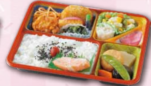
51 幕の内弁当〈葵〉 800 円 (18.5×23.0cm)