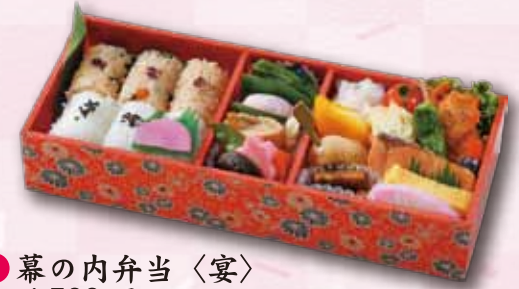
3 幕の内弁当〈宴〉 1,500 円 (11.0×26.5cm)