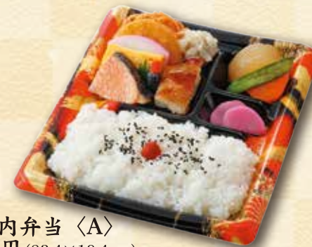
26 幕の内弁当〈A〉 600 円 (23.4×19.4cm)