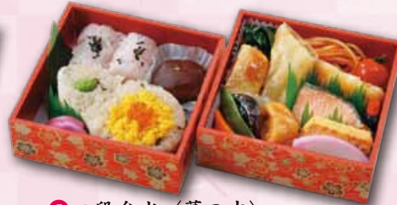
5 二段弁当〈幕の内〉 1,000 円 (12.5×12.5cm)