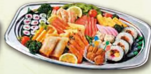
21 寿司入りオードブル 3,300 円 (28.0×44.0cm)