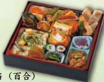
19 幕の内弁当 (百合) 2,000 円 (21.5×21.5cm)