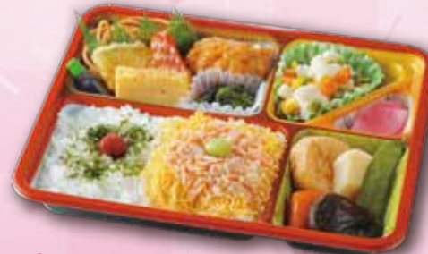
52 幕の内弁当〈楓〉 700 円 (18.5×23.0cm)