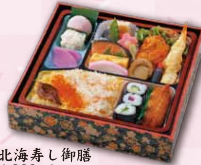
2 北海寿し御膳 1,800 円 (21.5×21.5cm)