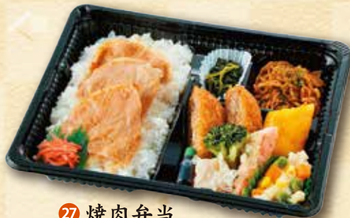
27 焼肉弁当 600 円 (18.5×22.0cm)