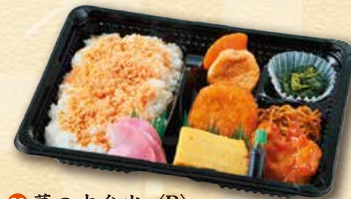
29 幕の内弁当〈B〉 500 円 (15.5×21.5cm)