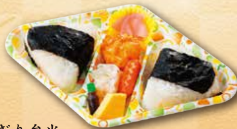
33 おにぎり弁当 460 円 (15.5×25.6cm)