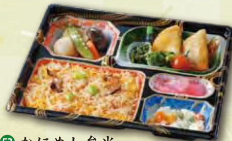
53 かにめし弁当 1,000 円 (21.5×26.5cm)