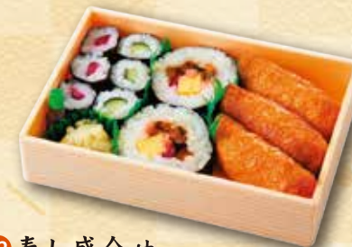
32 寿し盛合せ 460 円 (11.5×17.0cm)