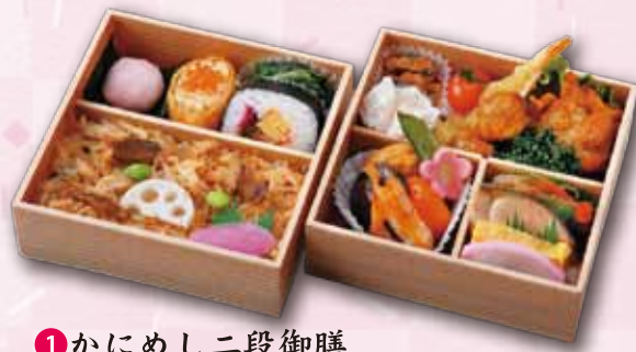
1 かにめし二段御膳 2,000 円 (15.0×15.0cm)