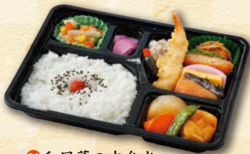
24 和風幕の内弁当 700 円 (19.5×26.0cm)