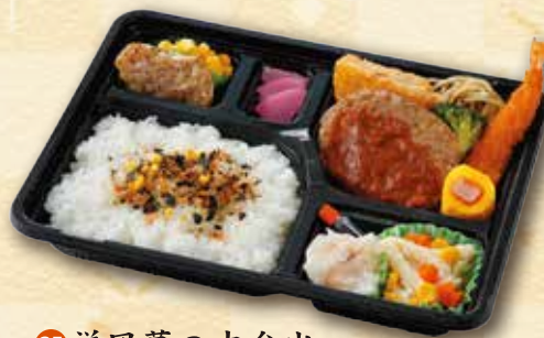
25 洋風幕の内弁当 700 円 (19.5×26.0cm)