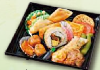
23 おつまみセット 800 円 (19.5×19.5cm)