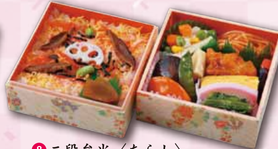
8 二段弁当〈ちらし〉 800 円 (11.7×11.7cm)