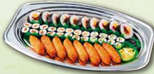
22 寿し盛セット 2,000 円 (28.0×44.0cm)