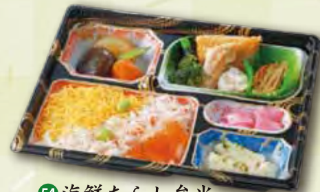
54 海鮮ちらし弁当 1,000 円 (21.5×26.5cm)