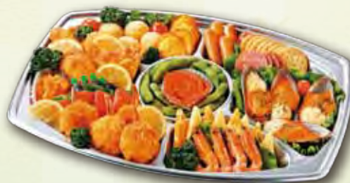
20 オードブル 5,000 円 (32.0×44.0cm)