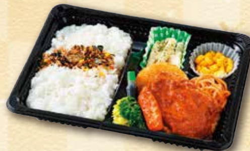
31 ハンバーグ弁当 500 円 (15.5×21.5cm)