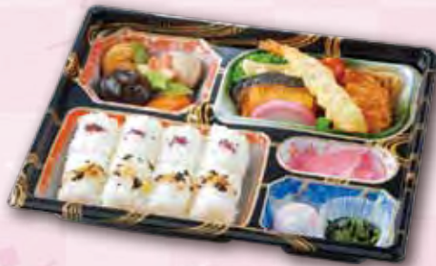
50 幕の内弁当〈錦〉 1,000 円 (21.5×26.5cm)