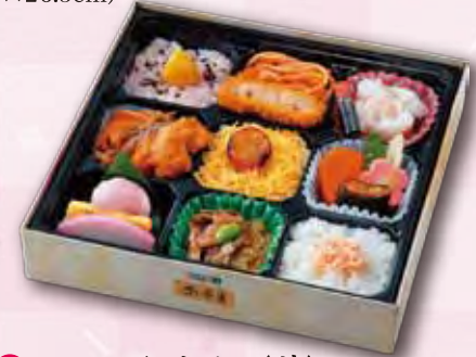
6 いろどり弁当〈華〉 1,000 円 (21.5×21.5cm)