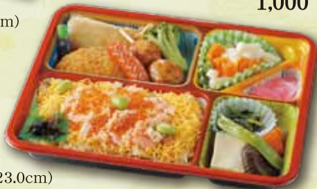
55 鮭めし弁当 900 円 (18.5×23.0cm)