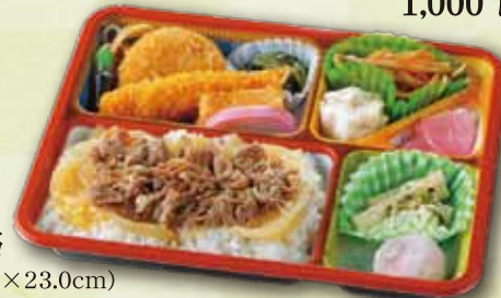
56 牛めし弁当 900 円 (18.5×23.0cm)